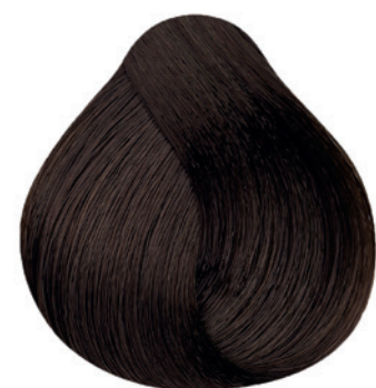
5.7 - Castanho Claro Marrom