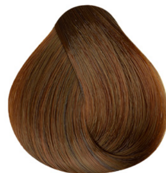
7.4 - Louro Médio Cobre