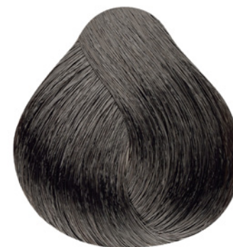
6.1 - Louro Escuro Cinza