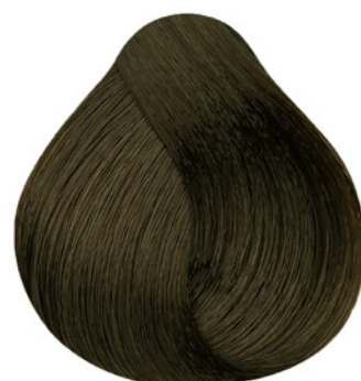
6.13 - Louro Escuro Cinza Dourado