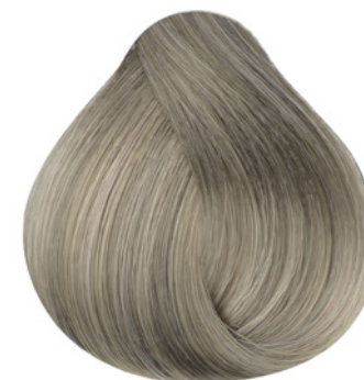
10.1 - Louro Claríssimo Cinza