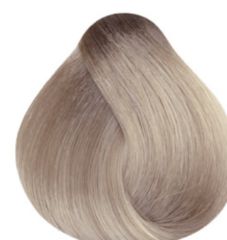
10.2 - Louro Claríssimo Irisado