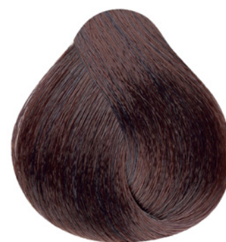
6.65 - Louro Escuro Vermelho Acaju