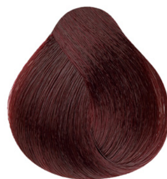
6.66 - Louro Escuro Vermelho Intenso