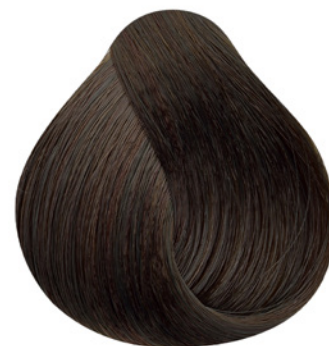
4.0 - Castanho Médio