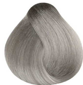
12.11 - Ultra Clareador Cinza Intenso