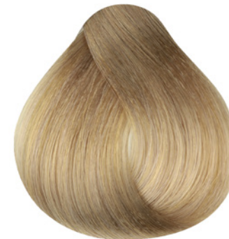
9.3 - Louro Muito Claro Dourado