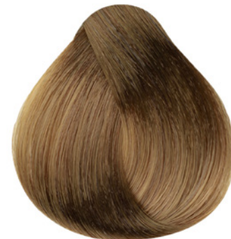
7.3 - Louro Médio Dourado