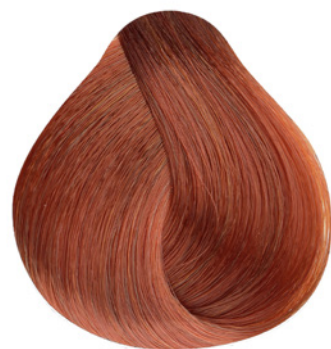
.44 - Mix Cobre