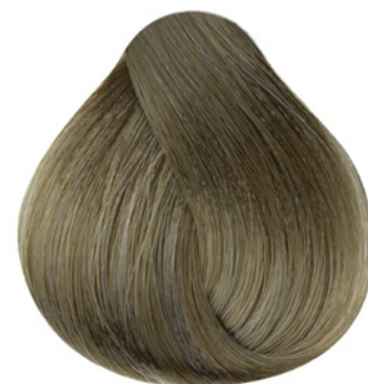
8.1 - Louro Claro Cinza