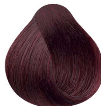
6.26 - Louro Escuro Irisado Vermelho