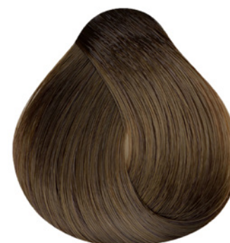
7.31 - Louro Médio Dourado Cinza