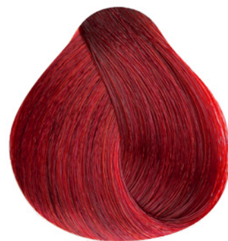
.66 - Mix Vermelho