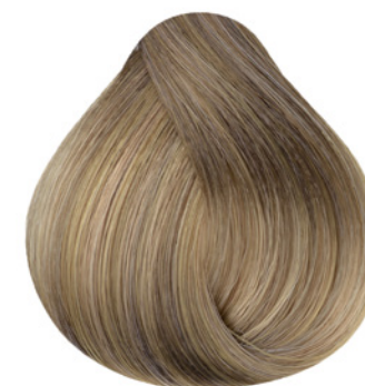
9.0 - Louro Muito Claro