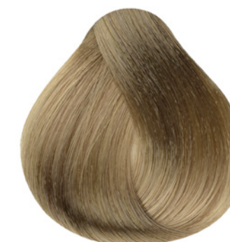
9.31 - Louro Muito Claro Dourado Cinza