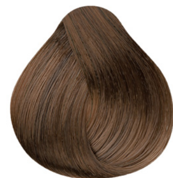
5.3 - Castanho Claro Dourado