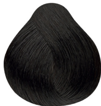
3.0 - Castanho Escuro