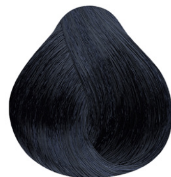
1.11 - Preto Azulado