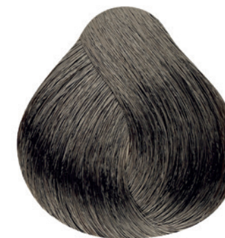
7.1 - Louro Médio Cinza