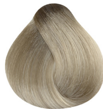
12.12 - Ultra Clareador Cinza Irisado