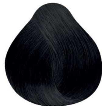
1.0 - Preto