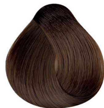
6.37 - Louro Escuro Dourado Marrom