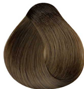
7.0 - Louro Médio