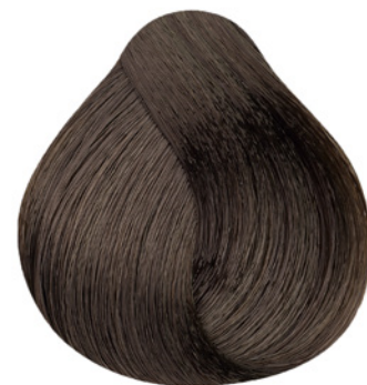
6.7 - Louro Escuro Marrom