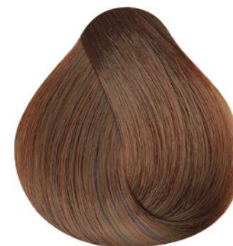
8.34 - Louro Claro Dourado Cobre