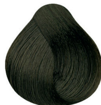
5.13 - Castanho Claro Cinza Dourado