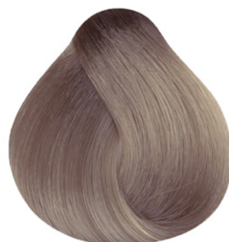
9.21 - Louro Muito Claro Irisado Cinza